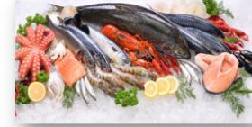
Promoción del consumo adecuado de peces, mariscos y algas (conocidos o poco conocidos)