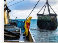
Economía pesquera local