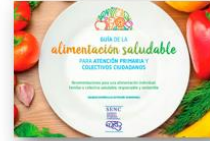
Guías alimentarias, recomendaciones dietéticas (raciones y especies de consumo) para población general y vulnerable, aspectos clínicos, etc.

1.8. Nos falta conocer la composición nutricional (incluyendo los metales pesados) de muchos peces, mariscos y algas